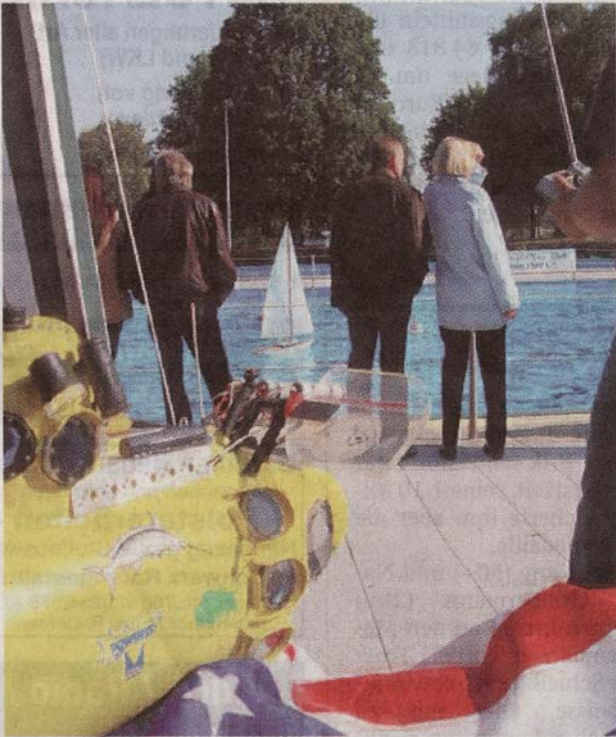
Vor interessiertem Publikum kreuzte dieser Segler durchs Becken. Im Vordergrund ein Miniatur-Forschungstauchboot.

Das große Becken im Werner Freibad, das die Stadt den Modellkapitänen zur Verfügung gestellt hatte, erwies sich als ideales Revier. Dank des klaren Wassers konnte man auch die U-Boot-Fahrten perfekt beobachten.