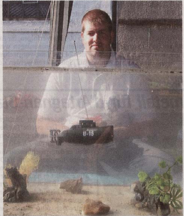
Nicht viel größer als ein Goldfisch ist dieses U-Boot, das zur Vorführung im Aquarium tauchte.