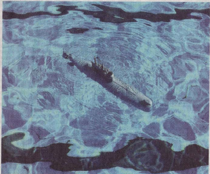
Ein Hobby, das was taucht: Der weltweit aktive Verein „Sonar“, der sich dem Bau von Modell-U-Booten widmet, war mit S 173, einem Aufklärungs-U-Boot aus den 60er Jahren, vertreten.